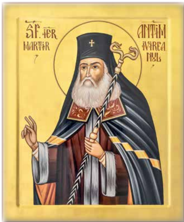
Sfântul Ierarh Martir Antim Ivireanul

2016 – ANUL COMEMORATIV AL SFÂNTULUI IERARH MARTIR ANTIM IVIREANUL ȘI AL TIPOGRAFILOR BISERICEȘTI (1716-2016)