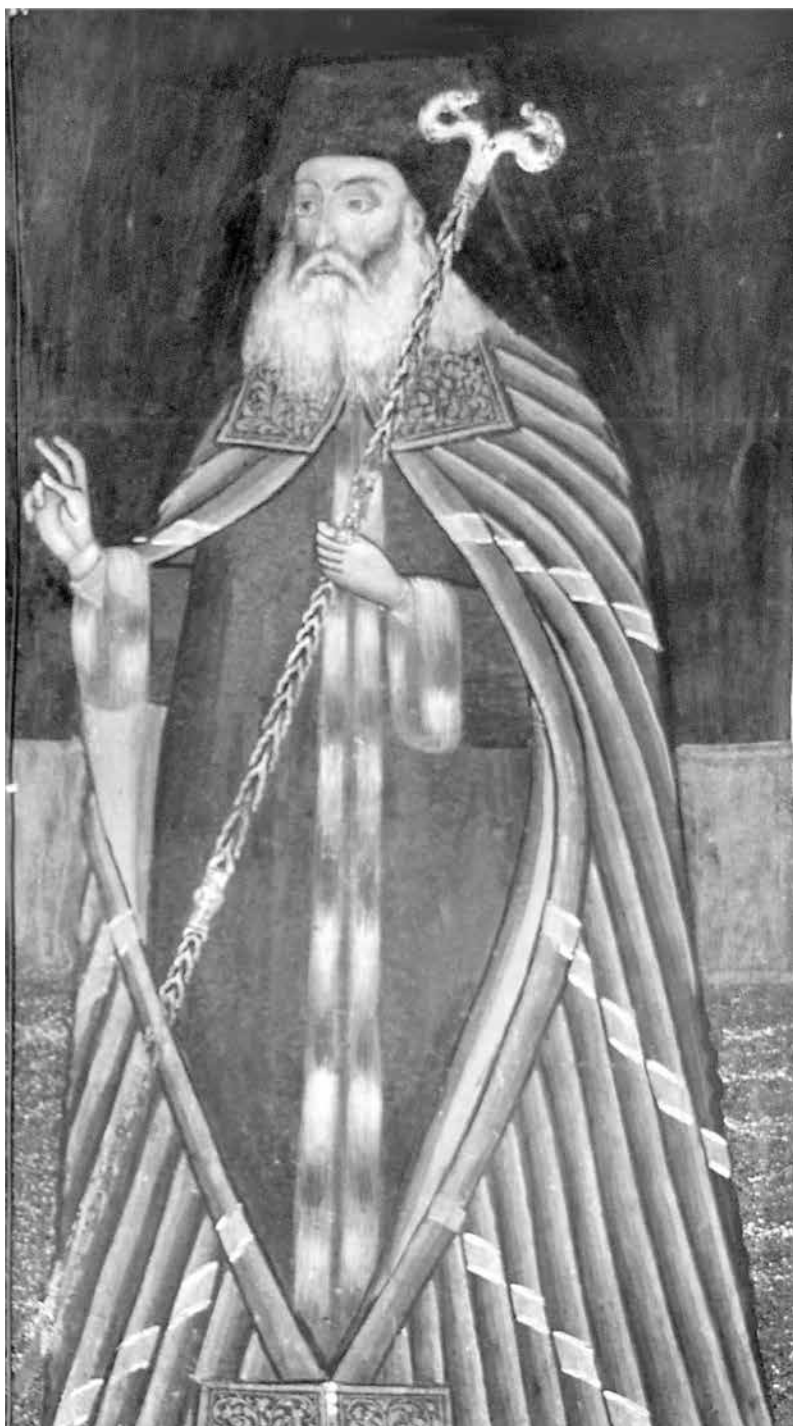
Sfântul Antim Ivireanul – Mănăstirea Govora