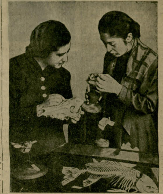
სტრატეგი ბიოლოგის ფაქტების IV ყიბრის ფრიალიანი სტუდენტობა ტობა ნ. ზაზიროვილი და ე. ვიკტორევიკი მკაცრდებენ ზეგნობიანთა ზოლო- გიის დიდი პრაქტიკების ჩასახულებად.