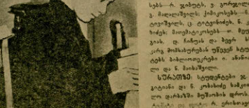
საბჭოთა კავშირის მთელი მოსახლეობა მუშაკების წინააღმდეგობას უწევს მსოფლიო ბურჟუაზიას.

დასახლებული ადგილების რაოდენობის გაძლიერებით უზრუნველყოფს.