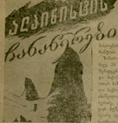
ქვემო ქალაქში მარცხელ ირ...