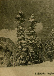
სამხარე მთების ხეობაში