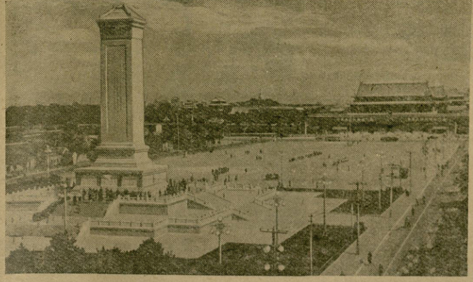
კაპინი. ტიანანმინის მოედანი, მარცხენა, პირველი პლანზე — სახალხო გმირთა ძეგლი.

მოთქვენ უპარტიო ახსნაგეგმვა. 1 ოქტომბერს ჩატარდა წრის პირველი მუშაობის თვეზე. „მუშაობა შობაობის წარმოშობა და მარქსიზმის გავრცელება რუსეთში“ (1883—1894 წწ.). წრის წევრებმა საკითხისადმი დიდი ინტერესი გამოიჩინეს. წრის მუშაობისას ჩატარდება თვეში ერთხელ.