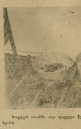
ზოგჯერ თაბაში ასე დატული წესრიგი და სისუფთავე. (I კორპუსი, თაბაი მე-13).

თვითნათი სტუდენტის ცალია ზუსტად და რეგულარულად დაიცავს საერთო საცხოვრებელ თაბების წესები. მეორეა ნასარიძე