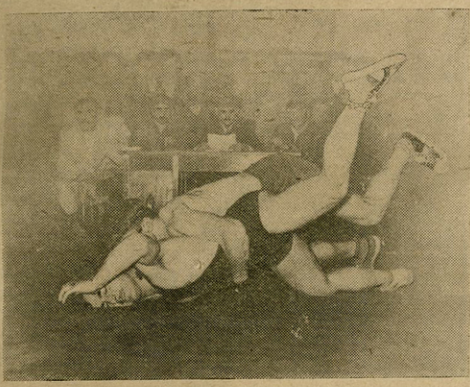
სურათში. ფინალური შეხვედრების ერთ-ერთი მომენტი.