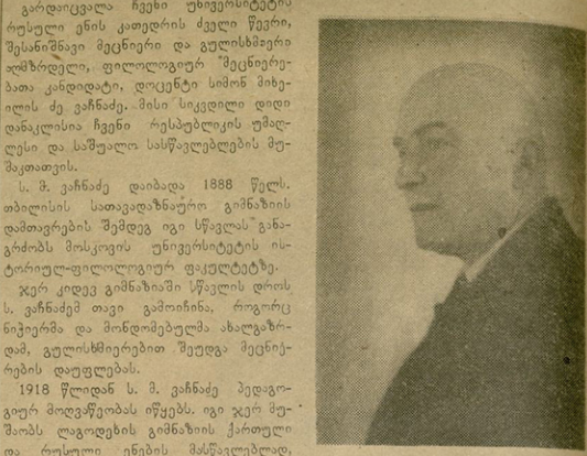
მოლოვეუბის მის კლასის ეკუთვნის სპორტულად გამოქვეყნებული და რამდენიმე გამოქვეყნებული შრომა.

უნივერსიტეტის სპორტული კლუბის საჯაროკო სექციამ ამ დღებში განიხილეს საკითხი აღნიშნული მოქალაქეთა არასპორტული საქმიანობის შესახებ.